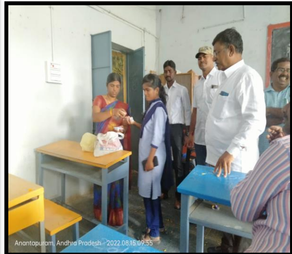
Students and staff saluting the flag and Distribution of sweets to the students by Office Staff.